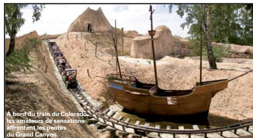
À bord du train du Colorado, les amateurs de sensations affrontent les pentes du Grand Canyon.

À la nuit tombée, place au spectacle. Le Mystère de la note bleue occupe la scène aquatique du parc. C'est l'histoire du DJ Mike, qui affronte DJFX, son homologue virtuel dans un duel musical à la recherche d'un son unique : la note bleue. Lasers, images géantes sur écrans d'eau, jets de feu et de lumières composent cette féerie musicale. Un autre spectacle, Max le clandestin du réel , permet de découvrir la technologie de la réalité augmentée. Petit personnage espion en 3D, il n'a qu'une idée en tête : échapper à son monde de synthèse, passer la frontière qui le sépare du monde réel et rejoindre les spectateurs... Le parcours dans le noir, les "yeux grands fermés" propose, lui, un nouveau voyage dans l'obscurité sur les canaux de Venise, sur l'Himalaya et la forêt amazonienne. Côté expositions, le parc présente Quand l'art rencontre la science (76 clichés grand format d'images