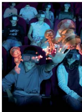
Les images en grand format des Astromouches font partager l'aventure de trois mouches clandestines à bord de la capsule spatiale Apollo.

Depuis le 7 février, les visiteurs du Futuroscope (Jaunay-Clan dans la Vienne) ont pu participer à de nouvelles expériences, entre imaginaire et monde réel. Du passé au futur, les images de Chocs cosmiques conduisent les spectateurs au cœur des impacts cosmiques pour découvrir comment de tels phénomènes modèlent l'univers. Retour en 1969 avec la fiction en Imax 3D, Astromouches , qui revisite avec humour l'histoire de la célèbre mission Apollo 11, le premier vol qui a conduit l'homme sur la lune. Alors que les astronautes s'apprentent à décoller, trois mouches s'infiltrèrent secrètement à bord de la capsule spatiale... Des années 60, on se projette en 2052 avec la course Ecodingo . Cette aventure en cinéma dynamique plonge les visiteurs dans un rallye trépidant parmi des véhicules volants écologiques.