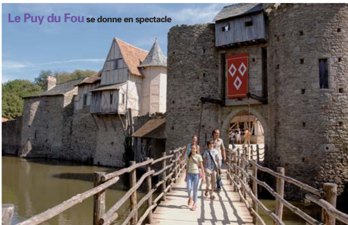
Le Puy du Fou convie à un voyage dans le temps. Comme ici, dans la cité médiévale.

En 2009, le Puy du Fou (Les Epesses en Vendée) affirme sa dimension de parc "spectacle" avec, dès le 16 avril, deux nouveautés. Les Grandes eaux, sur l'étang du site, sont un ballet de fontaines qui transportent les spectateurs aux grandes heures de Versailles. Sous la baguette de Jean-Baptiste Lully, les 120 fontaines géantes interpréteront une chorégraphie aquatique. Les Orgues de Feu permettront aux visiteurs de prolonger leur voyage dans le temps