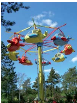
Le Denno Copter est l'une des nouvelles attractions proposées aux visiteurs de Dennlys Parc. Ici pas de sensations fortes, mais l'occasion de profiter de la vue sur le parc et ses alentours.

Et pour terminer, un nouveau jeu d'adresse avec l'Aquablata Pirate. Muni d'un canon à eau, il s'agit de viser des cibles disséminées sur une scène pour animer les automates qui s'y sont installés. Enfin, côté animations, un Musée de l'attraction foraine ouvre ses portes. Les visiteurs y découvriront de nombreux modèles réduits des plus beaux manèges de fêtes foraines d'hier à d'aujourd'hui. ●