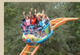
Le ragondingue est l'une des attractions du parc Bagatelle.

Astérix et au Puy du Fou qui, tous deux, sont accessibles aussi pendant les vacances de Noël. La recette du succès passe également par une offre tarifaire modulable et promotionnelle. Disney a ciblé les Franciliens et offert la gratuité pour les enfants, Astérix lançait le Pass Paradiloisirs qui, pour 84 euros par personne et par an, donne droit à l'accès illimité au village gaulois mais aussi à France Miniature, Grevin et la Mer de Sable. Parallèlement, des promotions continuent à fleurir sur Internet. Dernier ingrédient : la diversification des res-