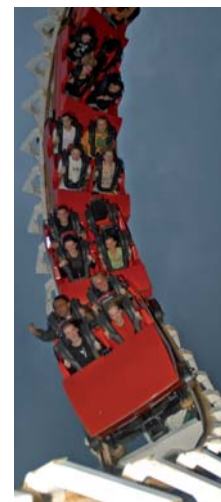
Sensations fortes garanties à bord du Waly Coaster du parc Walygator.

Successivement appelé Big Bang Schtroumpfs, Walibi Schtroumpfs et Walibi Lorraine, le site de Mazières-les-Metz (Moselle) est devenu en 2006 le parc Walygator. Pour fêter les 20 ans du site, dès le 4 avril, le cirque Biasini s'installera sur le parc pour deux à quatre représentations par jour, tout au long de la saison. Numéros de clowns, jongleurs, acrobates et Grande Illusion composent le programme orchestré par 11 artistes. Parmi les autres nouveautés : le Wally mille-pattes, un petit train à tête de chenille destiné aux plus jeunes, des nocturnes avec feux d'artifices les 27 juin, 11 juillet et 15 août, l'ouverture d'un pasta-bar au Croco Fresh, la création d'une enseigne "chic et choc" dans le décor exotique de "l'Inconnu", ou encore l'entrée au parc offerte aux seniors de 60 ans et plus, tous les jours (jusqu'à alors seule la gratuité était proposée les mercredis et samedis). Enfin, quelques dates clés à retenir : parade avec Bob l'éponge le 14 juillet, les Western days les 18 et 19 juillet, la parade des Looneys Toons le 15 août ou encore La nuit d'Halloween le 31 octobre. ●