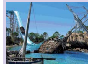
Furios Baco, une des attractions du parc Port Aventura. Composée de trois trains comportant six voitures, elle utilise un système d'accélération qui permet de passer de 0 à 135 km/h en trois secondes, sur un parcours de 900 mètres survolant la terre et l'eau et en passant par des tranchées et des tunnels. Avis aux amateurs !

Port Aventura , situé sur la Costa Dorada en Espagne, entre les villes de Salou et Vila-Seca, débutera sa saison 2009 le 27 mars prochain. Avec au programme : de nouveaux spectacles, l'ouverture d'un nouvel hôtel et l'inauguration d'un centre de conventions.