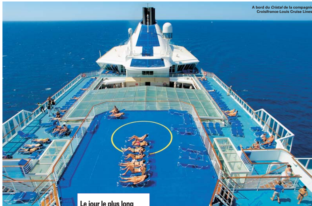
A bord du Cristal de la compagnie Croisifrance-Louis Cruise Lines.

La croisière connaît encore aujourd'hui des difficultés à trouver ses marques sur le marché français. Le produit a longtemps été considéré comme inadapté à la vente en agence de voyages. Un phénomène qui se vérifiait encore récemment avec Internet. Pourtant, les compagnies ne cessent de se mobiliser en direction des distributeurs, en multipliant les séances de formation, les visites de navires,