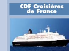
Avec Le Bleu de France , navire à taille humaine, CDF Croisières de France a mis en place un produit unique principalement adapté et pensé pour le marché français.

► Le Seabourn Odyssey vient de rejoindre la flotte de The Yachts of Seabourn. ► Cunard Line prendra livraison du Queen Elizabeth , actuellement en construction dans les chantiers italiens, début octobre 2010. Les ventes sont déjà ouvertes.