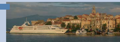
Le MS La Belle de l'Adriatique est un bateau de dernière génération à taille humaine.