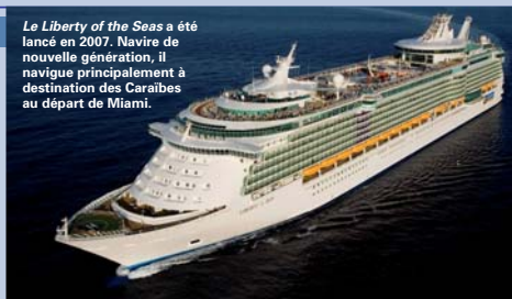
Le Liberty of the Seas a été lancé en 2007. Navire de nouvelle génération, il navigue principalement à destination des Caraïbes au départ de Miami.

• Celebrity Cruises dispose d'une flotte de 11 navires, d'une capacité de 92 à 2050 passagers. Fin 2008, la nouvelle classe Solstice de la compagnie a vu le jour, axée sur le haut de gamme et le luxe. • Azamara Cruises, lancée en 2007 par Celebrity Cruises, est une compagnie constituée de deux petits navires de croisières haut de gamme : Azamara Journey et Azamara Quest (694 passagers).