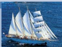
Copie d'un ancien clipper du XIXe siècle, le Star Clipper à quatre mâts navigue à la voile le plus souvent possible lors des croisières.

► Pour la première fois depuis 2007, les 3 voiliers seront positionnés en Méditerranée pour la saison d'été 2010. ► Hiver 2010/2011, le Costa Rica sera proposé au départ de Puerto Caldera. ► Deux croisières inédites avec le Royal Clipper : "Rome/Athènes" en 11 nuits du 27 juin au 8 juillet (Civitavecchia, Capri, Taormine, Gozo, La Valette, Tripoli, Al Khoms, Yithion, Nauplie et Athènes), et "Athènes/Rome" en 10 nuits du 8 juillet au 18 juillet (Athènes, Nauplie, Yithion, Al Khoms, Tripoli, La Valette, Gozo, Taormine, Capri et Civitavecchia). Avec la possibilité de segmenter les itinéraires via un embarquement/débarquement à Malte.