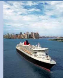
Le Queen Mary 2 de la compagnie Cunard Line, un navire de légende.