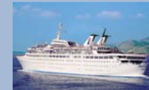
L'Orient Queen, au décor oriental, navigue en Méditerranée.

(représentant en France des compagnies Louis Hellenic Cruises et Louis Cruise Lines)