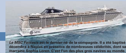
Le MSC Fantasia est le dernier-né de la compagnie. Il a été baptisé fin décembre à Naples en présence de nombreuses célébrités, dont sa marraine Sophia Loren. C'est l'un des plus gros navires au monde.

► 2009 voit le lancement de trois itinéraires : Sillages méditerranéens (France-Italie-Tunisie-Espagne en 7 nuits) et Parfums méditerranéens (France-Italie-Malte-Tunisie-Espagne en huit nuits) opérés par L'Orient Queen, et Rivages méditerranéens (France-Espagne-Tunisie-Malte-Italie en six nuits) effectué par Le Coral.