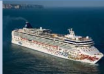
Le Norwegian Gem proposera fin avril 2010 des croisières de sept nuits au départ de Venise vers les îles grecques, la côte dalmate et la Turquie.

• La Norwegian Cruise Line dispose d'une flotte de 11 bateaux. D'une capacité variant de 1462 à 2394 passagers, ils offrent chacun de 6 à 12 restaurants, de 9 à 11 bars et salons, d'un centre fitness et spa, de deux piscines, d'une piscine enfants et de 4 à 6 bains à remous. Le Norwegian Pearl et le Norwegian Gem proposent en plus un bowling et un mur d'escalade, tandis que le Pride of America offre entre autres un trampoline à l'élastique. • Carnival Cruise Lines dispose d'une flotte de 22 bateaux. D'une capacité de 2052 à 3646 passagers, ils offrent chacun un centre de remise en forme, un