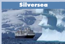
Le Prince Albert II, bateau d'expédition, navigue au cœur des étendues sauvages et glacées de l'Antarctique.