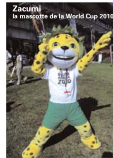
Zacumi la mascotte de la World Cup 2010

Les voyageurs qui ont souhaité s'impliquer pour la Coupe du monde de football qui se déroulera en Afrique du Sud, du 11 juin au 11 juillet 2010, ont dû