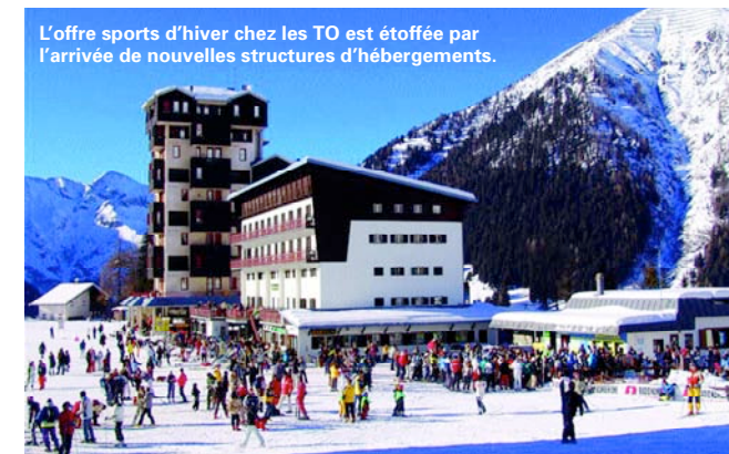
L'offre sports d'hiver chez les TO est étoffée par l'arrivée de nouvelles structures d'hébergements.

Sur l'océan Indien, Austral Lagons multiplie les valeurs ajoutées avec