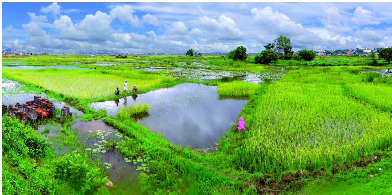
Dans la zone océan Indien, Madagascar fait la une des TO à travers une solide programmation.