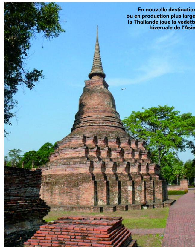
En nouvelle destination ou en production plus large, la Thaïlande joue la vedette hivernale de l'Asie.

Thomas Cook choisit de mettre en avant les Caraïbes, à l'exemple des Bahamas, de la République dominicaine, de la Guadeloupe et de la Martinique où s'ouvriront prochainement les premiers spas. De son côté, Rev Vacances propose une croisière sur le Carnival Valor au départ de Miami, tandis que National Tours navigue à bord du Bleu de France , de Saint-Domingue aux îles vierges, via Sainte-Lucie, la Martinique, la Guadeloupe et Saint-Martin. Un dernier produit également adopté par Marsans, qui lance par ailleurs un itinéraire avec location de voiture, de nouveaux hôtels pour des séjours balnéaires, ou encore des packages de deux nuits à compléter selon ses envies. Sur la République dominicaine, Marsans crée des forfaits spas, golf et plongée, et propose des vols directs au départ de Marseille et de Nantes-Atlantique